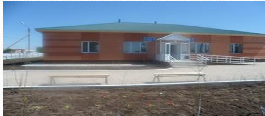
1 - Сабундинская врачебная амбулатория - 25 посещений в смену, 10 коек дневного пребывания больных.