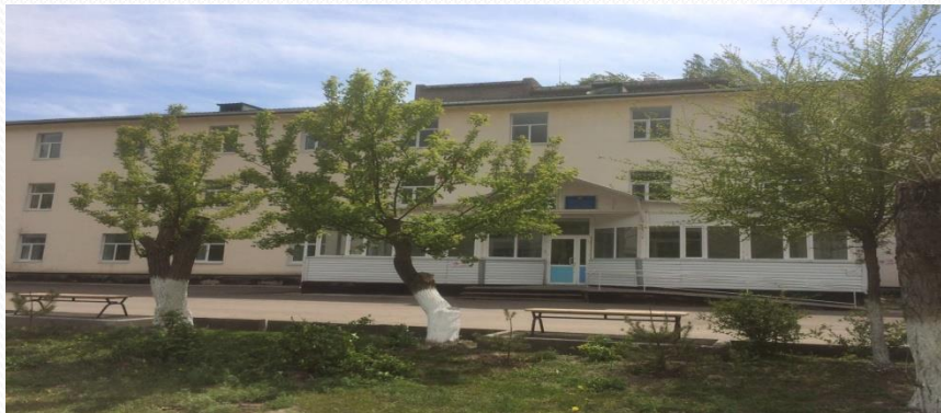
1 - Районная больница (36 КС и 10 при АПП коек) с поликлиникой на - 60 посещений в смену.